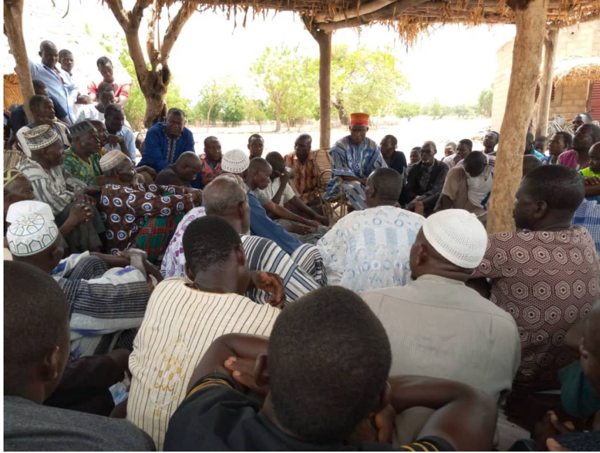
Réunion du Chef du village avec les notables pour l'attribution du terrain construction du CEG