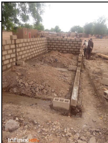
Démarrage de la construction du 2ème moulin

La phase construction du local est en voie d'achèvement à ce jour, la phase équipement en matériel interviendra très prochainement pour une mise en service dès le début septembre prochain.